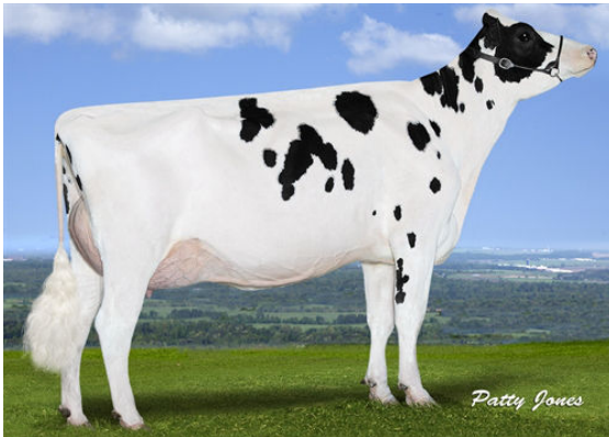
EDG DAHLIA MOGUL 2257 GRANDDAM